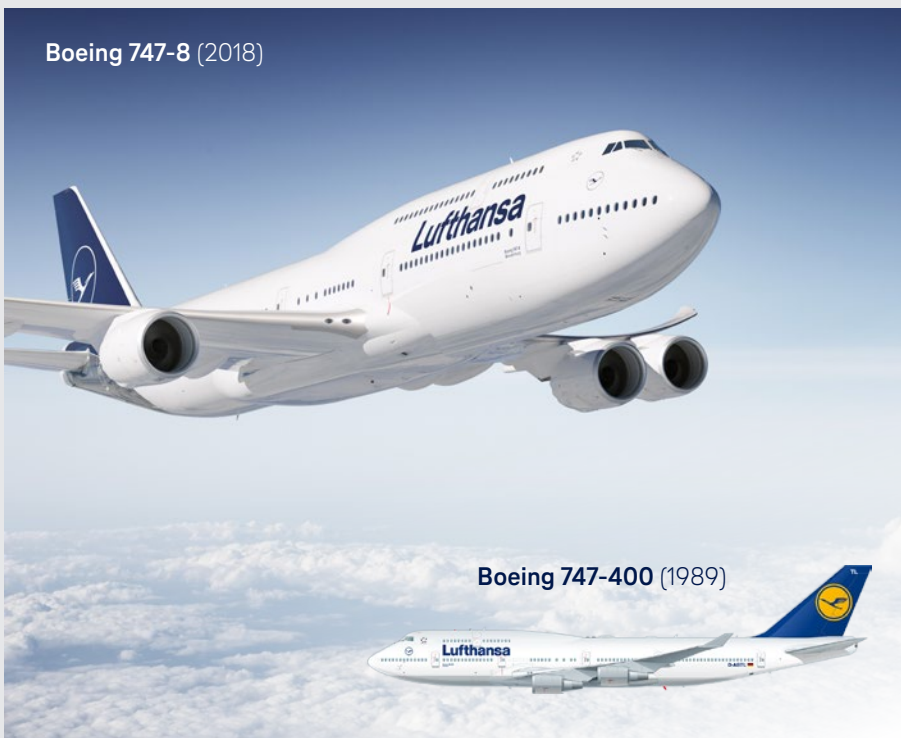
Boeing 747-8 (2018)

Nach 30 Jahren gibt sich Lufthansa wieder ein neues Erscheinungsbild. Markanteste Änderung: Der oftmals als Spiegelei bezeichnete gelbe Kreis auf dem Seitenleitwerk verschwindet – und der Kranich prangt nun auf einem dunkleren Blau.